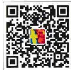
“中国驻瑞典大使馆”微信