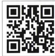
“中国领事服务网”微博